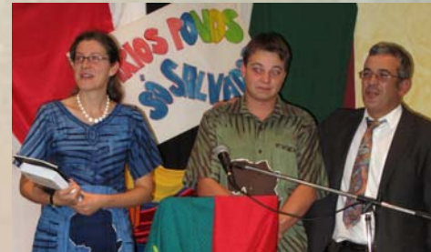
Missionstag in der Gemeinde "O Caminho"

den Inseln von Äquatorial-Guinea ausgehen kann, begünstigt durch die geographische Nähe. Sehen aber nun immer mehr, seit dem wir hier in Portugal sind, dass auch viele Gründe