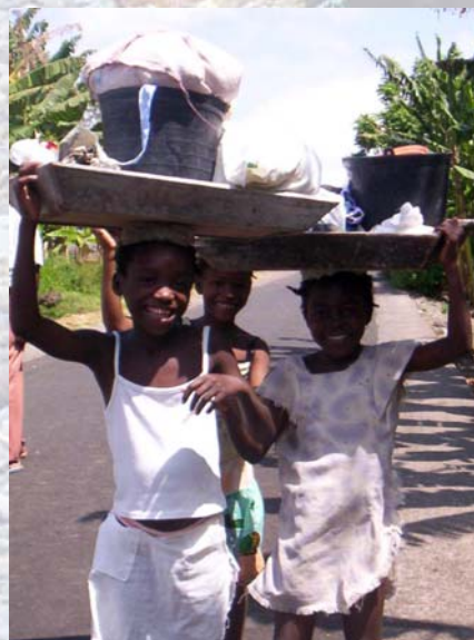
Die Mädchen auf dem Weg zum Fluss um Wäsche zu waschen.

das Leben, niemand kommt zum Vater als durch mich.“ Aber nur als zu oft versuchen die Menschen durch Werke wie die Anbetung Marias oder anderer Heiligen und durch gute Taten der Nächstenliebe ihr Heil zu verdienen. Dieses Denken finden wir auch in den vielen Sekten wieder, die sich in São Tomé niedergelassen haben. Sie suggerieren den Menschen, dass sie durch ihre Gaben, ihr Geld das sie in die angebliche Gemeinde investieren, bei Gott Anerkennung finden. Dieses System der „Opfergaben“ ist den Insulanern durch ihren Geisterglauben bekannt, so dass sie schnell Zugang zu diesen vermeintlich christlichen Gruppierungen finden. Kaum „ein Ohr“ hat bis jetzt in São Tomé gehört was im Johannes Ev. 3,16 steht: „Gott hat die Menschen so sehr geliebt, dass er seinen einzigen Sohn für sie hergab. Jeder, der an ihn glaubt, wird nicht verloren gehen, sondern das ewige Leben haben.“ So sehr liebt uns Gott.