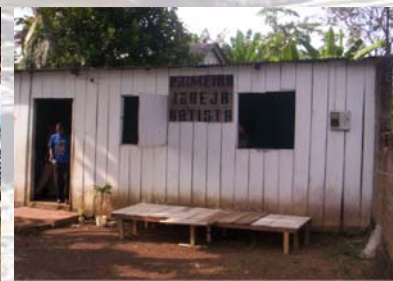
Eine der „großen“ Gemeinden in ST&P