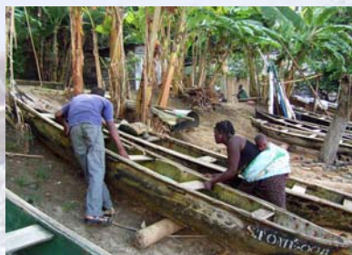
viele Familien leben vom Fischfang