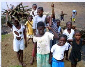
Kinder der Volksgruppe Angolares