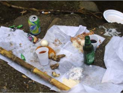
Opfergaben an die Flussgeister

Diese Botschaft muss für die Bewohner der Inseln São Tomé & Príncipe wirklich unglaublich sein. Für sie, die dorthin als Sklaven, später als Arbeiter verschleppt wurden und nicht wieder in ihre Heimat zurückkehren konnten. Für sie, die als Nachfahren dieser Plantagenarbeiter dort geboren wurden und nie einen anderen Flecken Erde betreten haben. Für sie, die außerhalb der Hauptstadt nur die Grundschule besuchen konnten und nie wirklich Zugang zu Bildung hatten. Für sie, die von den weißen Herren regiert wurden, sich minderwertig fühlen und sich in der Armut der Inseln