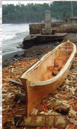
etwas Neues soll entstehen

Paulus schreibt im Römerbrief 10,13-15: Denn „wer den Namen des Herrn anrufen wird, soll gerettet werden“. Wie sollen sie aber den anrufen, an den sie nicht glauben? Wie sollen sie aber an den glauben, von dem sie nichts gehört haben? Wie sollen sie aber hören ohne Prediger? Wie sollen sie aber predigen, wenn sie nicht gesandt werden? Das Ziel ist, Menschen für die Ewigkeit zu retten. Der Ausgangspunkt muss sein, Prediger auszusenden um den Weg der Rettung zu verbreiten. An diesem Punkt wollen wir nun mit unserer zukünftigen Arbeit in São Tomé & Príncipe ansetzen. Unser Plan ist, die schon vorhandenen kleinen evangel. Gemeinden in der Hauptstadt zu unterstützen, selbst Prediger zu den noch vom Evangelium unerreichten Menschen der Insel zu senden. Wir möchten im