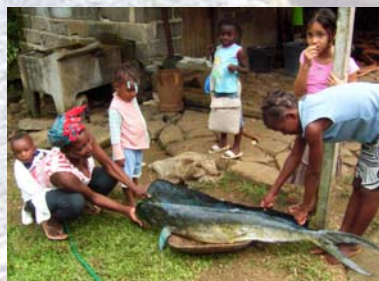
Festessen für die ganze Familie